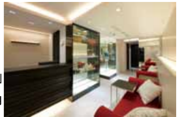
直営サロン「エスプリビューティー」(東京・六本木)「AQUAMOISTURE」の体験利用もできる

「AQUAMOISTURE」—— (株)エミシア / サロン「エスプリビューティー」