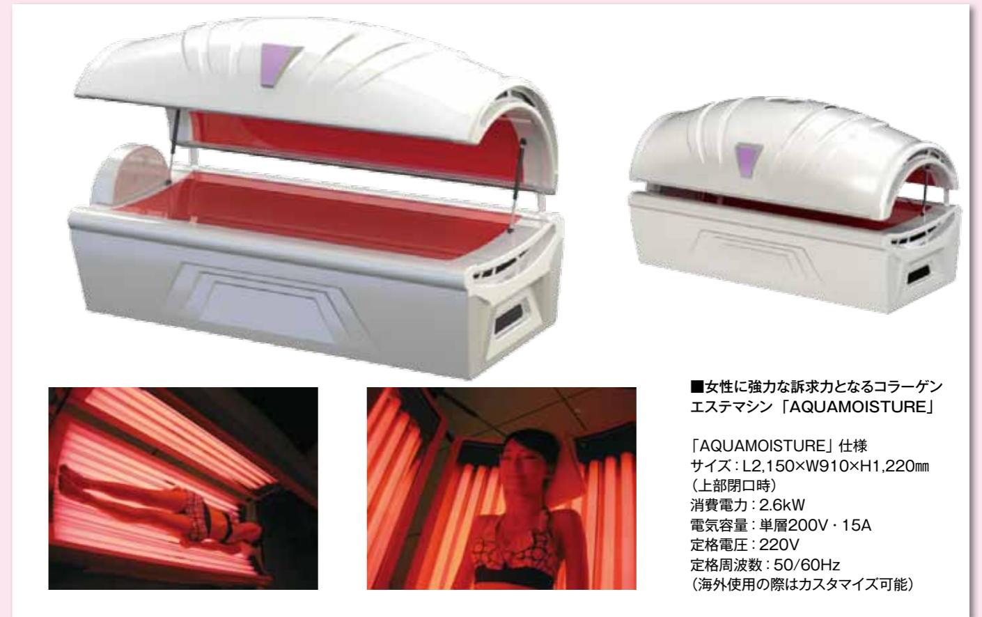
■女性に強力な訴求力となるコラーゲンエステマシン「AQUAMOISTURE」

同社によれば「個人差はありますが、使用者の80%が翌日に肌の改善を感じているというモニタリングデータがあります」という。もちろん、1週間に1～2回のペースで使用すれば、さらに肌の改善が進み、同データでは「30回の使用では、94%が目覚ましい改善、6%が改善を感じている」という結果が示されているという。最初の使用で