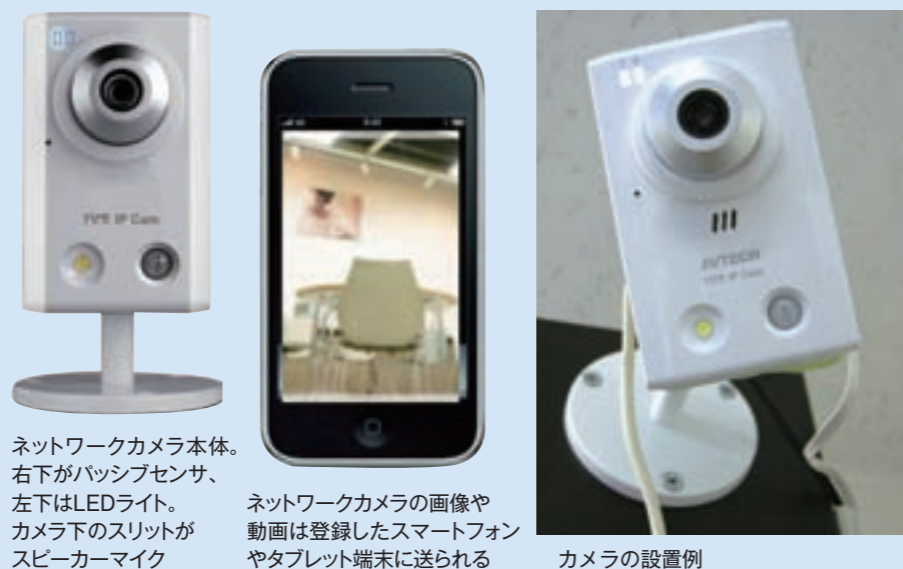
ネットワークカメラ本体。右下がパッシブセンサ、左下はLEDライト。カメラ下のスリットがスピーカーマイク ネットワークカメラの画像や動画は登録したスマートフォンやタブレット端末に送られる カメラの設置例

(株)キャトルプランが提唱するネットワークカメラ (LAN に接続できるカメラ) を使った「PUSH VIDEO」は、インターネットとスマートフォン、タ