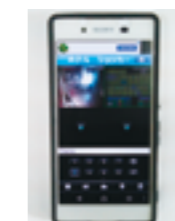
リネンモニター画面や監視カメラ映像をホテルを離れた経営者のスマホへ伝送