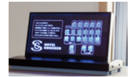
コストを抑えながらLEDによる 発色変化が特徴