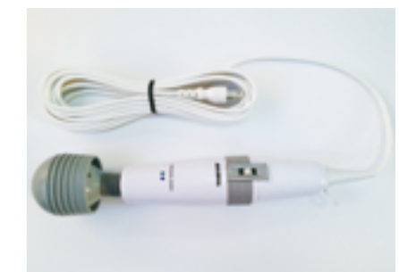
ロングケーブル(5m、3m)の電マ。 ねじれにくい小判コードを採用