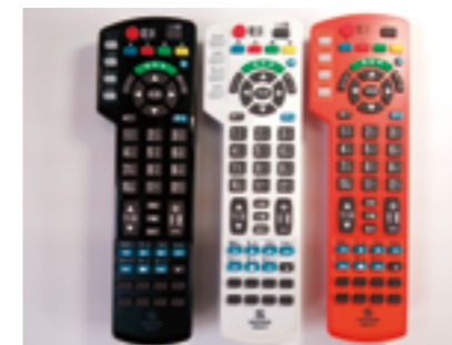
2世代目のシンプルで 使いやすいボタン式学習リモコン