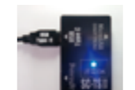
充電器の状態を手軽に チェックできる通電検査器