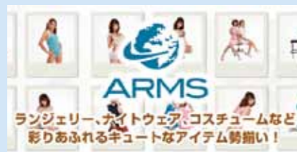
「LH-NEXTショッピングモール」にも出店。(本号の同社「LH-NEXTショッピングモール」ガイドは126~133頁に掲載)

塩ビは以前から使用されてきた素材で製造コストも低い。しかし金型の制約から形状が限定される。一方、最近、海外製品などで増えてきたのがシリコン製。ただ、コストが高く高価格になってしまう。その中間のコストで注目が高まっているのが、エラストマーという素材。形状の自由度が高く透明感がありバイブレーターに使用するには魅力的な素材。ただ、造形に技術力が必要で、東南アジア等では製造できず国内でも製造できる工場に限られる。