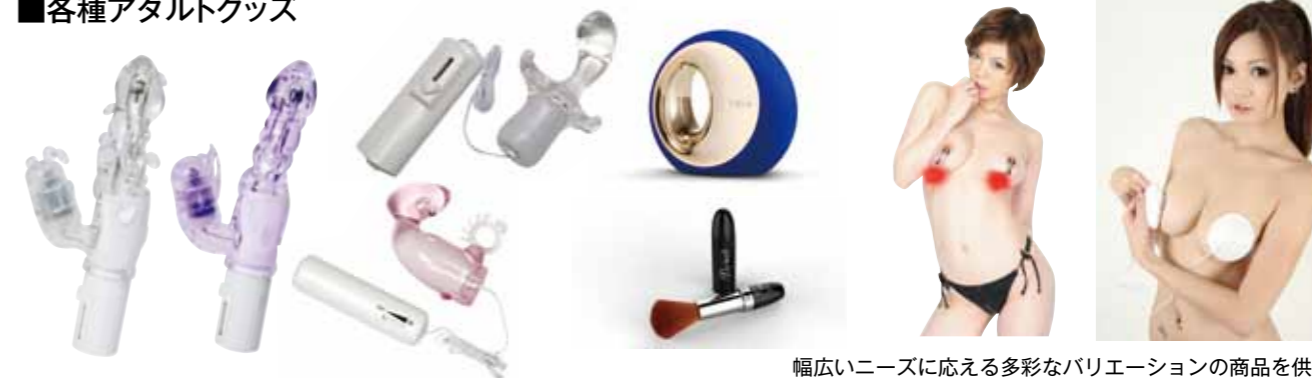
幅広いニーズに応える多彩なバリエーションの商品を供給