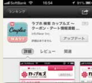
・Android、iPhoneの両OSでアプリを設置 ・「カップルズ」のトップ画面はこちら