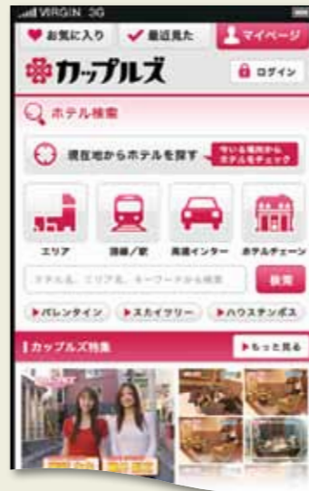
・検索しやすさを重視